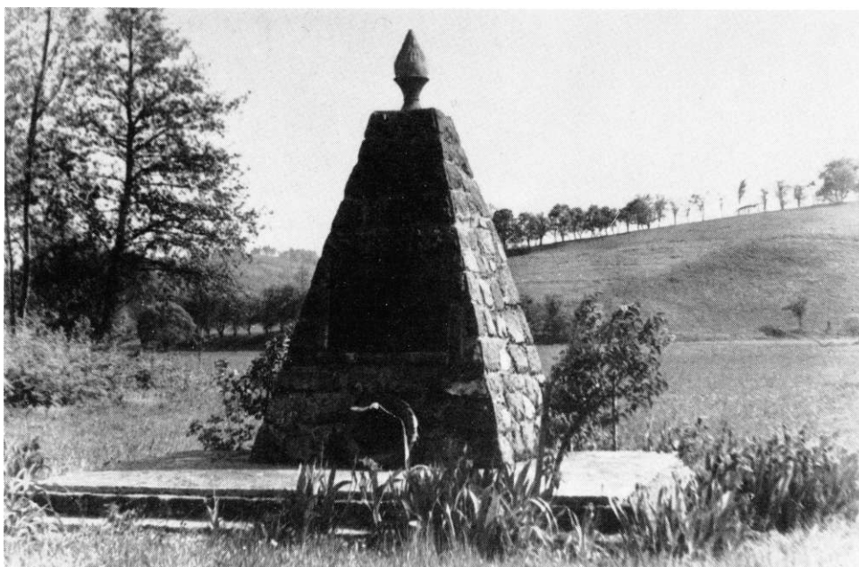
Spomenik žrtvama fašističkog terora

Tako je selo Crevarska Strana, kao i druga sela kotara Vrginmost, živjelo u miru, pošteno, gostoljubivo i prijateljski sa svakim, bez obzira odakle je i koje je vjere. Ali, došla je 1941. godina. Nijemci i Italijani okupirali su zemlju, stvorili tzv. »NDH«, došli i u Vrginmost i vlast dali ustašama. Nastao je nemir, strah i bojazan za život, i to ne bez razloga.