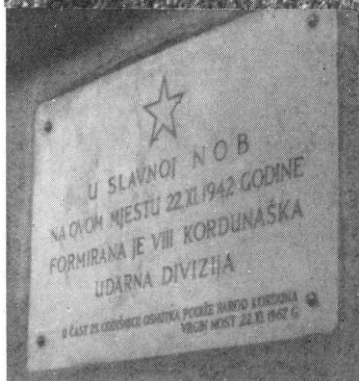
Škola sa spomen-pločom gdje je formirana 8. Kordunaška udarna divizija

Tokom rata bilo je 135 žrtava fašističkog terora, od čega je većina poginula već 1941. godine. Pored toga, umrlo je od tifusa 35, a od drugih posljedica rata 2 lica. Od ukupnih gubitaka bilo je 155 muškaraca i 37 žena.