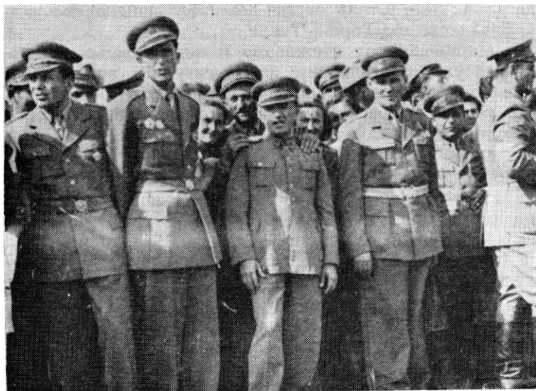
Група преживелих бораца 4. војвођанске бригаде на смотри у Руми 1953.

превити и нахранити; некоме заштити дугме или закрпити поцепане панталоне, блузу, шињел; организовати праше и сушеше рубља и пареше одела; пружити болесном или повређеном мештанину помоћ. А кад би све ове послове посвршавале, обично је требало наставити марш. За другарице је остајало скоро увек мало, а понекад и нимало времена за одмор.