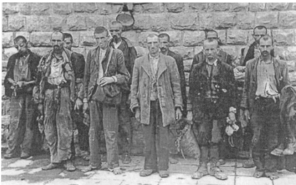
Група припадника НОП-а по изласку из логора на Бањица

Био је то највећи концентрациони логор на подручју Србије од 1941 до 1944. Кроз њега прошло је преко 250.000 заточеника, а око 30.000 је стрељано на стратишту у Јајинцима. Мањи број логораша је стрељан и у кругу логора. Ту је, у дворишту, почетком 1942. године постављен грудобран, који је коришћен за стрељање, а било је случајева убистава из чисте обести, које су најчешће вршили припадници специјалне полиције. 8