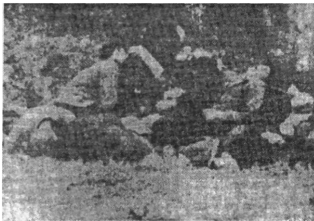
Стрељани на Крушику у Ваљево 27. 11. 1941.

„... Сирељање се и даље наставља... Затвореници су и даље узнемирени и са зебњом очекују када ће доћи на ред. Кроз Главу ми струји мноштво најразноврснијих идеја. Рафали више нису стравични, јер си су се донекле већ