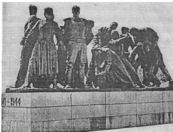
Споменик отпора и победе

што носили - то им је била једина имовина.