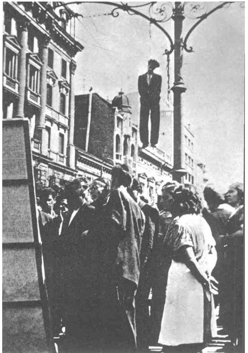
ITALIJANSKI FAŠISTI STRFLJAJU PRIPADNIKE NA RODNOOSI.OBODI1 AfKOG POKRETA KOD CFTI NJA JULA 1941 GODINE