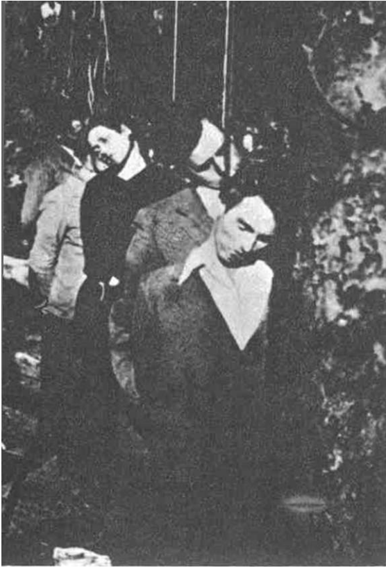
\IM\CKI ZLOČIN I I'ANCFM U LETO 1941 GODINE