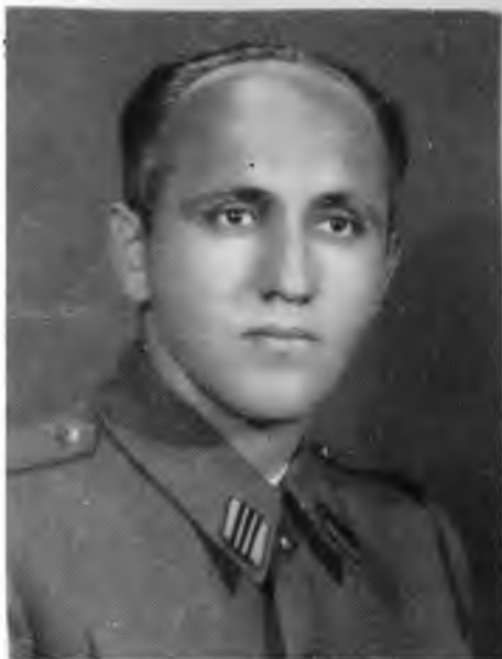
ВОЈО КОВАЧЕВИЋ, ПОЛИТИЧКИ КОМЕСАР ГЛАВНОГ ШТАБА