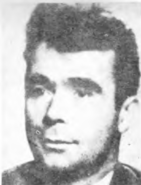
МИЛОСАВ МИЛОСАВЉЕВИЋ, ПОЛИТИЧКИ КОМЕСАР ГЛАВНОГ ШТАБА