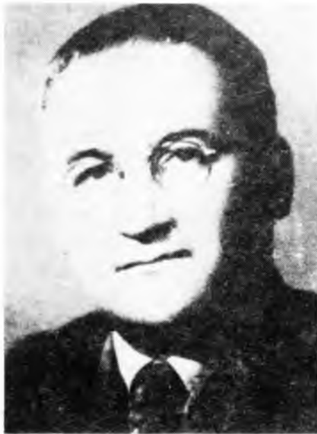
МОМЧИЛО МАРКОВИЋ, ПОЛИТИЧКИ КОМЕСАР ГЛАВНОГ ШТАБА