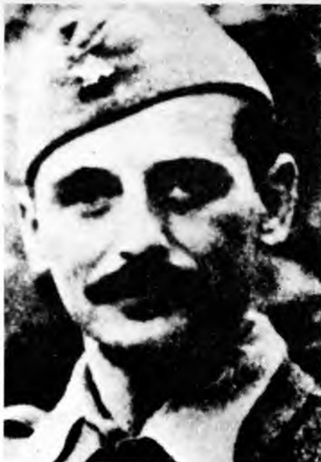
КОЧА ПОПОВИЋ, КОМАНДАНТ ГШ ЗА СРБИЈУ