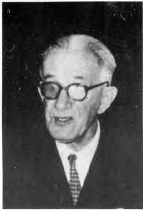
СИМИЈА СТАНКОВИЋ, ПРЕДСЕДНИК УПОСА