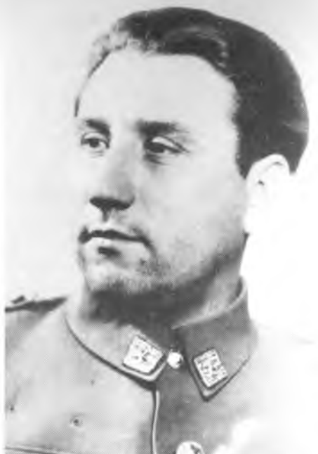
АЛЕКСАНДАР РАНКОВИЋ, СЕКРЕТАР НК КПЗ СРБИЈУ